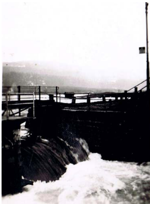
Quand la cabane du pêcheur, là-bas, a les pieds dans l'eau 2 .

Néanmoins, si l'on en revient à cette même presse locale et un an plus tôt, on se rend compte que l'abondance des eaux pour le mois de janvier, du 10 au 20 essentiellement avait su retenir les différents chroniqueurs. Pour preuve, ces extraits de la FAVJ du 19 janvier 1955 :