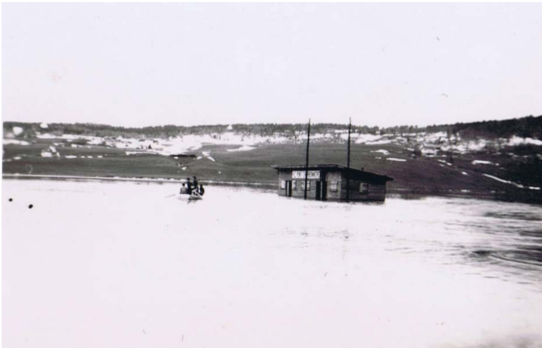
Ces braves ne savent pas encore que dans moins de deux semaines leur cabane voguera sur l'eau !