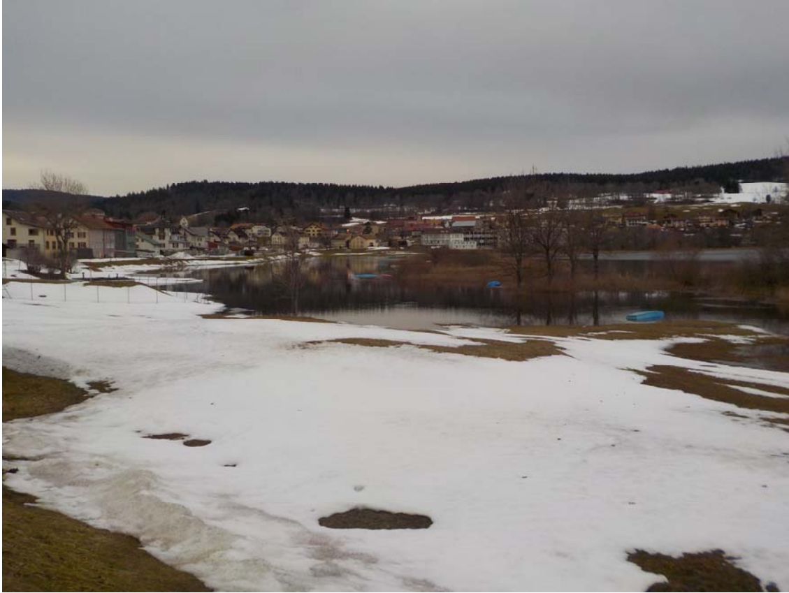
Etat du lac Brenet le 25 janvier 2018 avec l'eau du lac de Joux qui passe par-dessus le barrage.